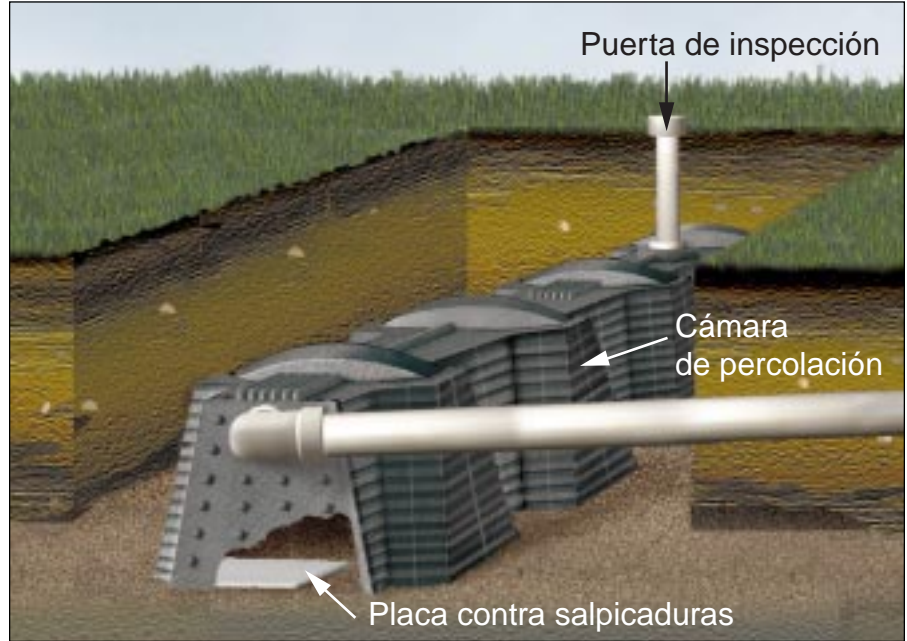
Figura 2: Las zanjas de la cámara de percolación no pueden ser más largas de 150 pies.

Las cámaras de percolación son un producto de marca registrada, así que, por favor, siga las recomendaciones del fabricante para hacer el mantenimiento del sistema. Otras indicaciones son: