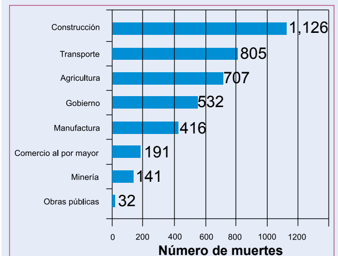
Figura 2. Número de muertes por sector industrial.